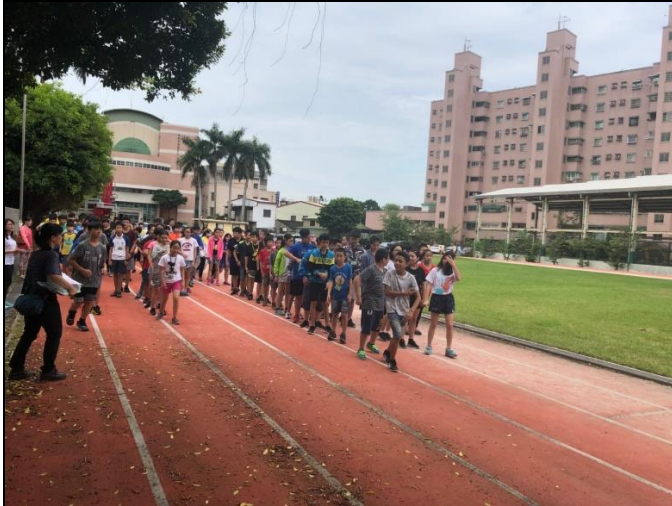
說明：第一圈全班一起跑