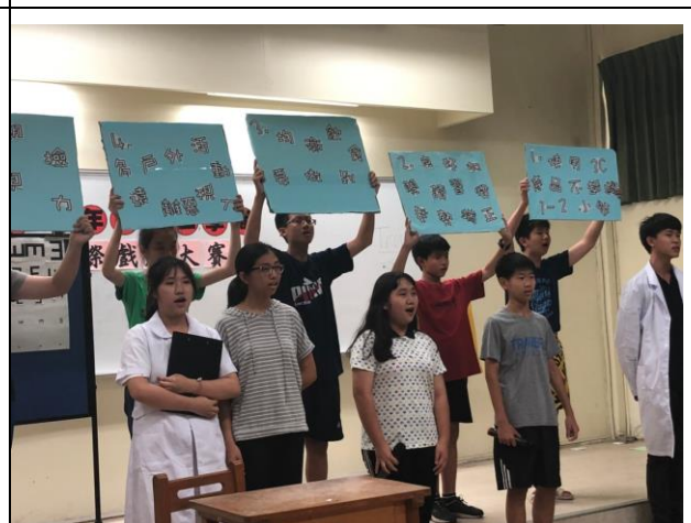
說明：視力保健納入戲劇大賽議題