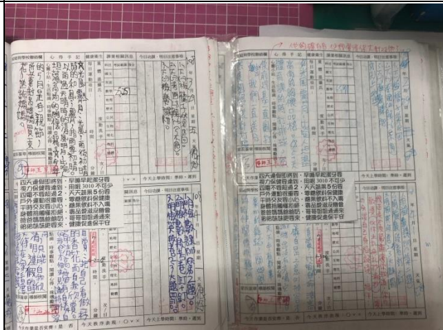
說明:連假前在連絡簿貼健康促進小卡