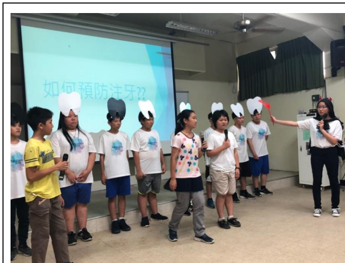
說明:口腔衛生保健納入戲劇大賽議題