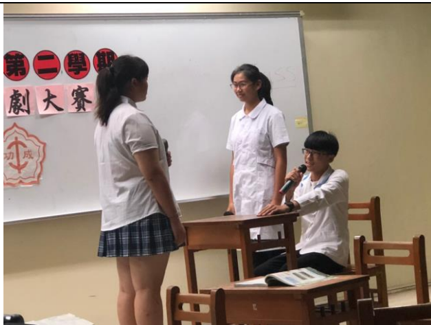
說明：正確用藥納入戲劇大賽議題