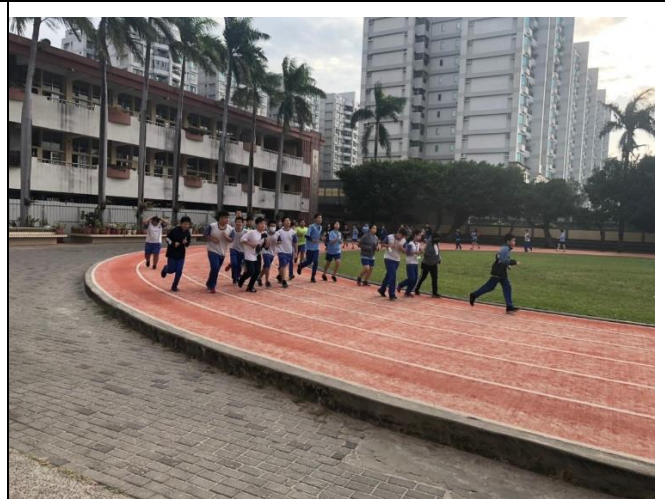
說明：第二圈開始可以依照自己速度跑