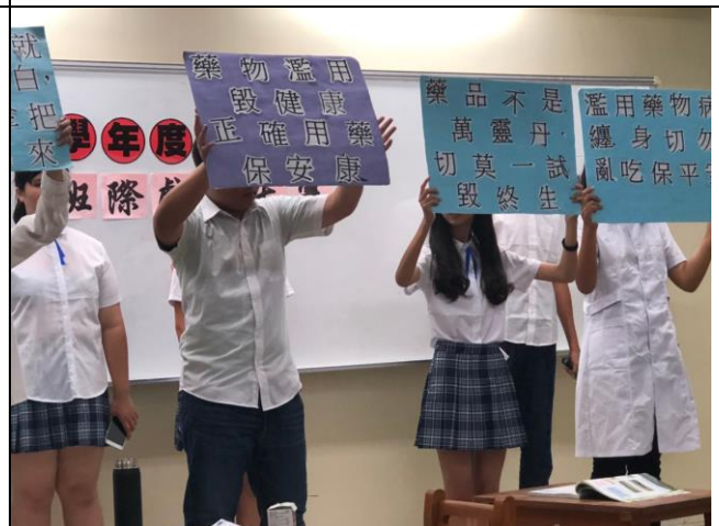
說明：正確用藥納入戲劇大賽議題