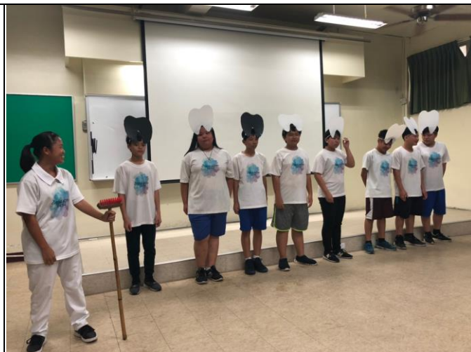
說明:口腔衛生保健納入戲劇大賽議題