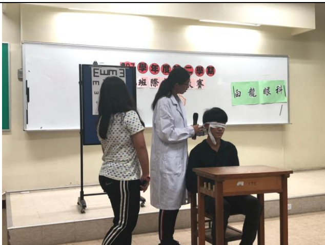
說明：視力保健納入戲劇大賽議題